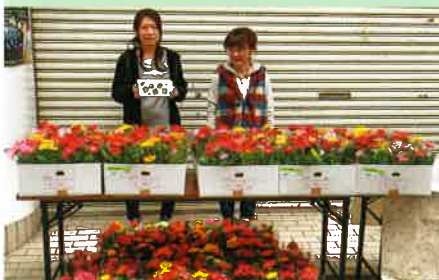
フェスティバルでの緑の募金活動 (塩飽こころのフェスティバル実行委員会)