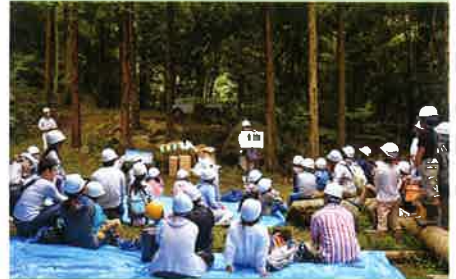
紙芝居を使った森林づくり活動の学習 (NPO法人香川ベンチの会)