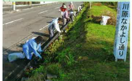
「川原なかよし通り」の環境整備 (川原自治会)