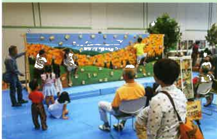
2019ウッディフェスティバル (香川県木材需要拡大協議会)