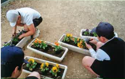
パンジーの植え付け (高松市立三溪小学校)