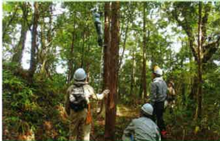
枝打ち作業 (森づくり香川連絡会・林援塾)