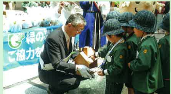
「緑の募金」街頭キャンペーン