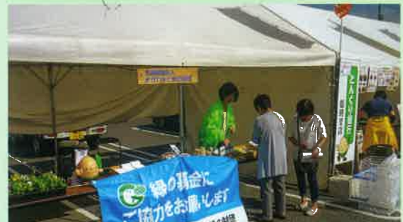
イベントでの募金活動(ウディフェスティバル)

皆様からお寄せいただいた「緑の募金」は、潤いと安らぎに満ちた、みどり豊かな郷土を創造するため、緑化の推進及び森林の整備などに有効に活用しています。