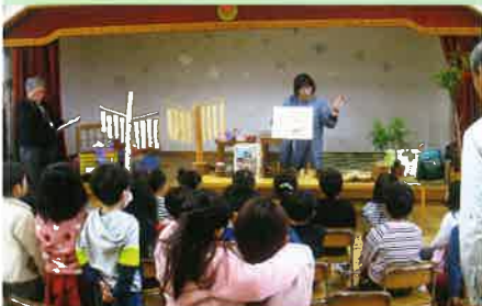
保育所での環境学習の授業 (NPO法人フォレストーズ香川)

緑とのふれあいなどを通じて森林環境学習を行い、森林づくり活動等への参加促進に要する経費を助成します